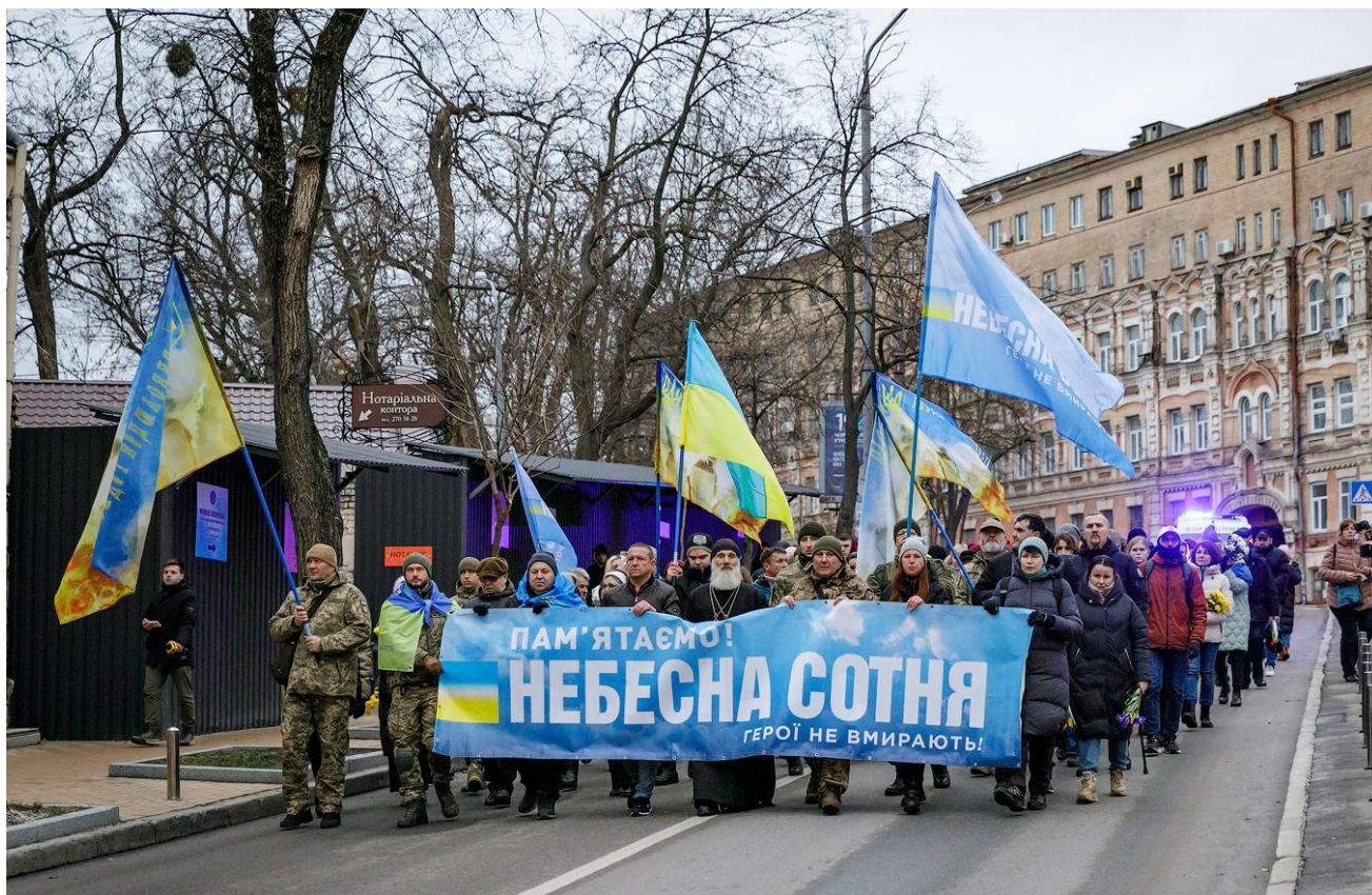
Щорічна хода пам'яті.