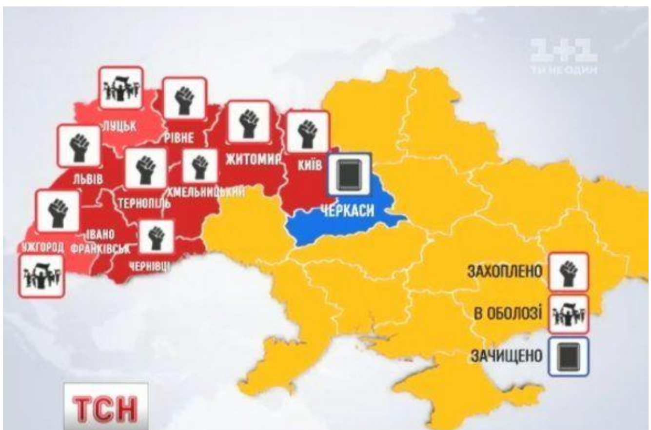
Карта України з позначенням міст, в яких активісти взяли під контроль будівлі державних адміністрацій, станом на 24 січня 2014 року. Із сайту ТСН: https://tsn.ua/vypusky/tsn/vipusk-tsn-19-30-za-24-sichnya-2014-roku-331206.html

На засіданні Штабу національного спротиву ухвалили рішення про активізацію Майданів у регіонах. Як наслідок, в областях України активісти почали збиратись у будівлях обласних державних адміністрацій, щоб не дати представникам влади можливість застосовувати силові методи. Станом на кінець дня 24 січня під контроль протестувальників було взято вісім облдержадміністрацій (разом із Київською міською державною адміністрацією, яку мітингарі контролювали ще від 1 грудня 2013 року): Івано-Франківську, Чернівецьку, Тернопільську, Рівненську, Львівську, Хмельницьку ОДА, Житомирську МДА. У Луцьку й Ужгороді активісти оточили будівлі адміністрацій. У Черкасах силовикам удалося відбити у мітингувальників приміщення раніше захопленої адміністрації.