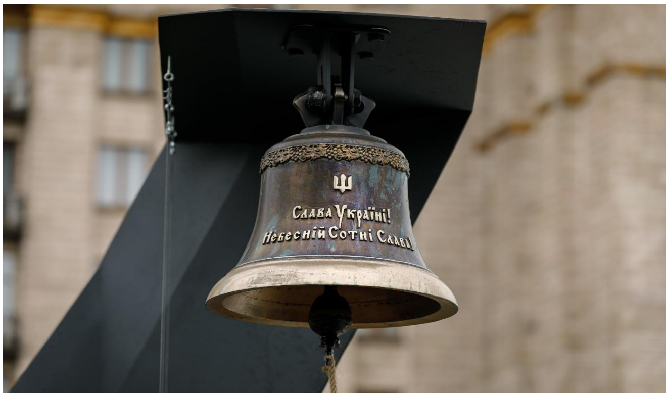
Дзвін Гідності на алеї Героїв Небесної Сотні у Києві.

Персональне вшанування кожного з Небесної Сотні є важливою практикою інституалізації суспільної пам'яті про події Революції Гідності, розширення загальнодоступних форм пошанування пам'яті загиблих, що слугує зокрема впровадженню в суспільстві моральних імперативів, гідних поваги та наслідування. Більше інформації за посиланням.