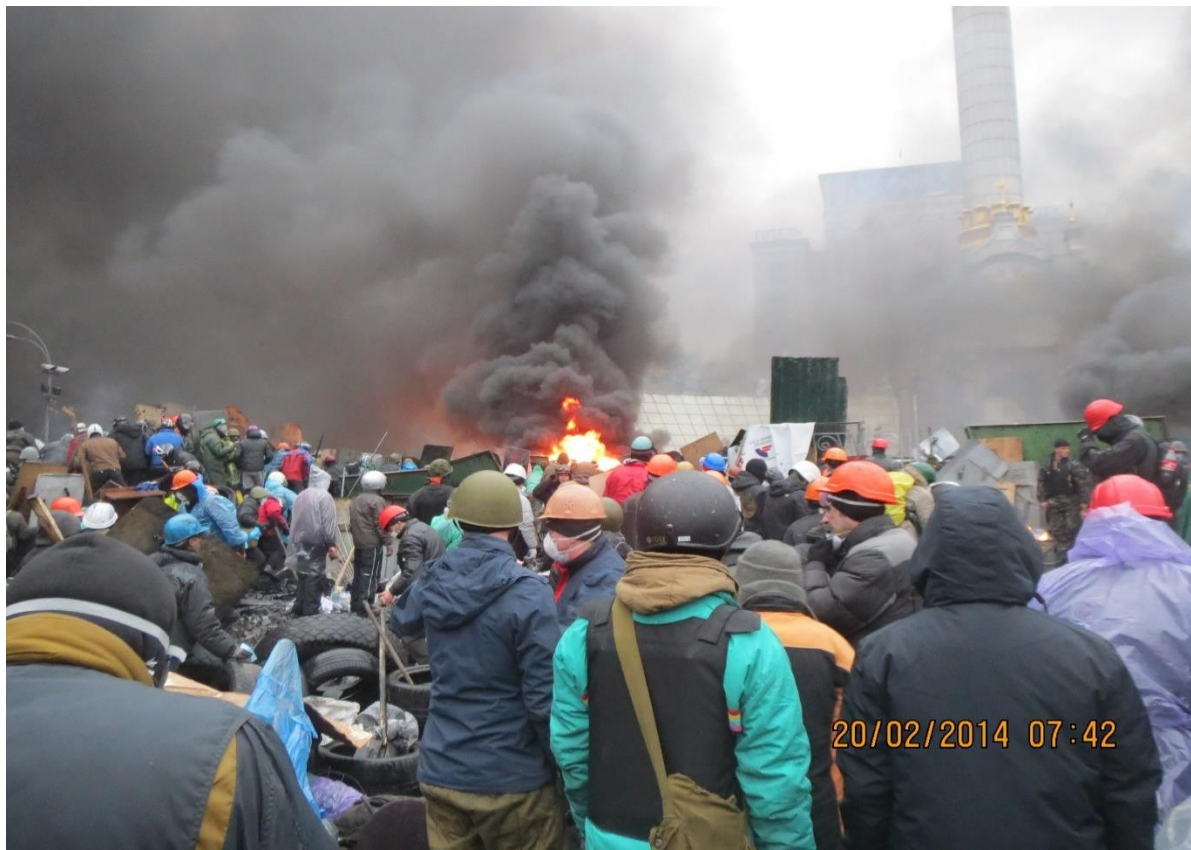
Майдан. Ранок 20 лютого на майдані Незалежності.