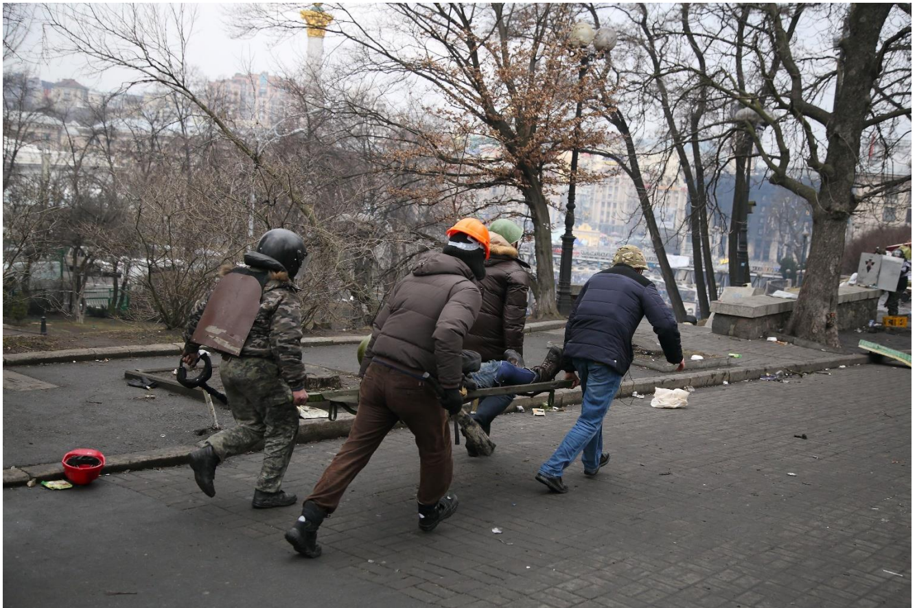
20 лютого 2014 р. Евакуація пораненого.