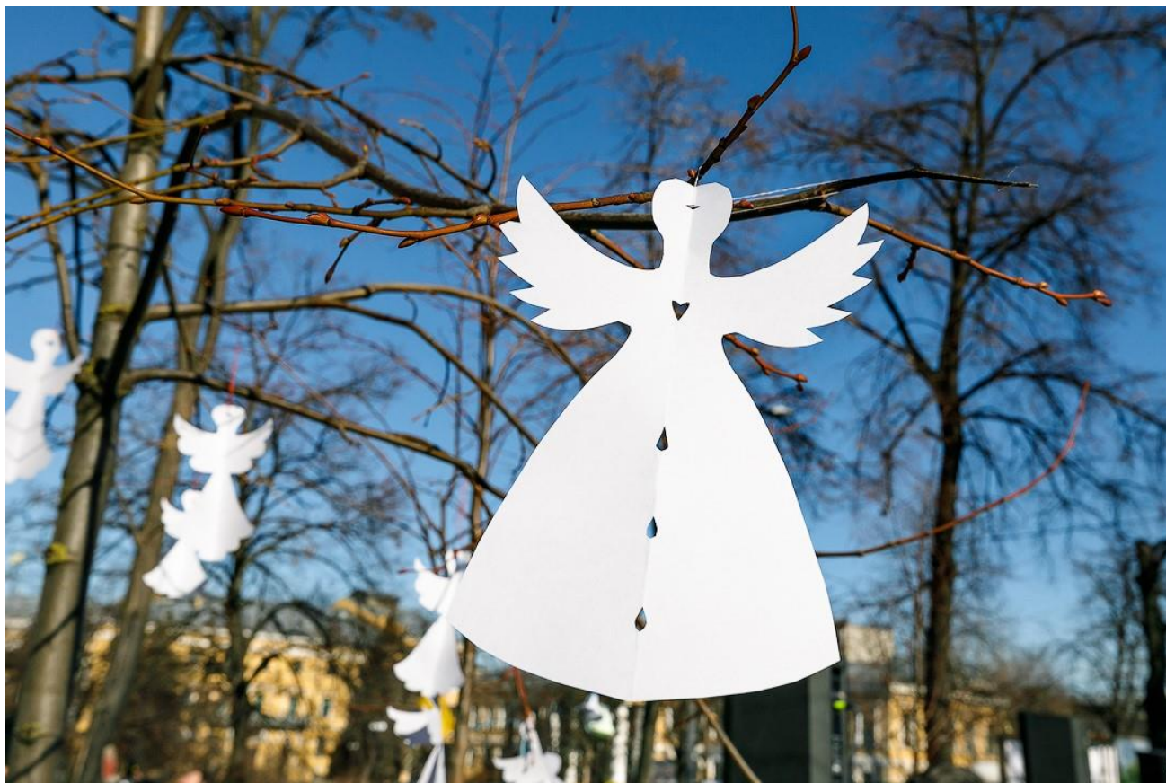
Ангели на алеї героїв Небесної Сотні.

Всесвітню тиху акцію “Ангели пам’яті”, присвячену Небесній Сотні, ініціювали громадська активістка та співачка Анжеліка Рудницька й мистецька агенція “Територія А”. У пам’ять про активістів Майдану традиційно розвішують паперових ангелів на місці розстрілу найбільшої кількості мітингувальників. Ангели символізують душі загиблих борців за свободу та перемогу світла над темрявою.