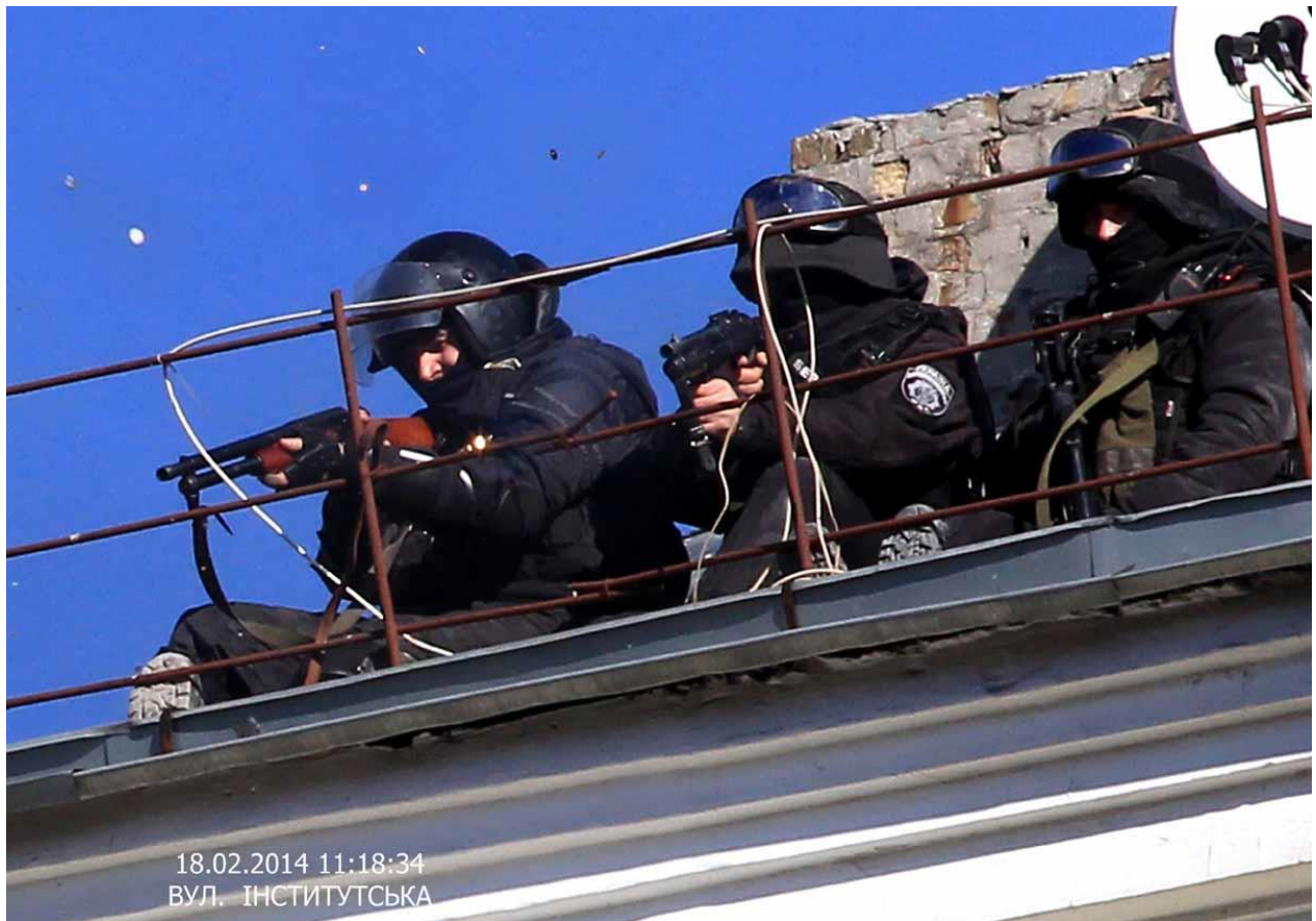
Силовики на дахах урядового кварталу ціляться в учасників «мирного наступу».