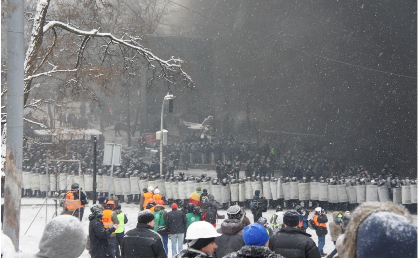
Вулиця Грушевського 22 січня 2014 року.