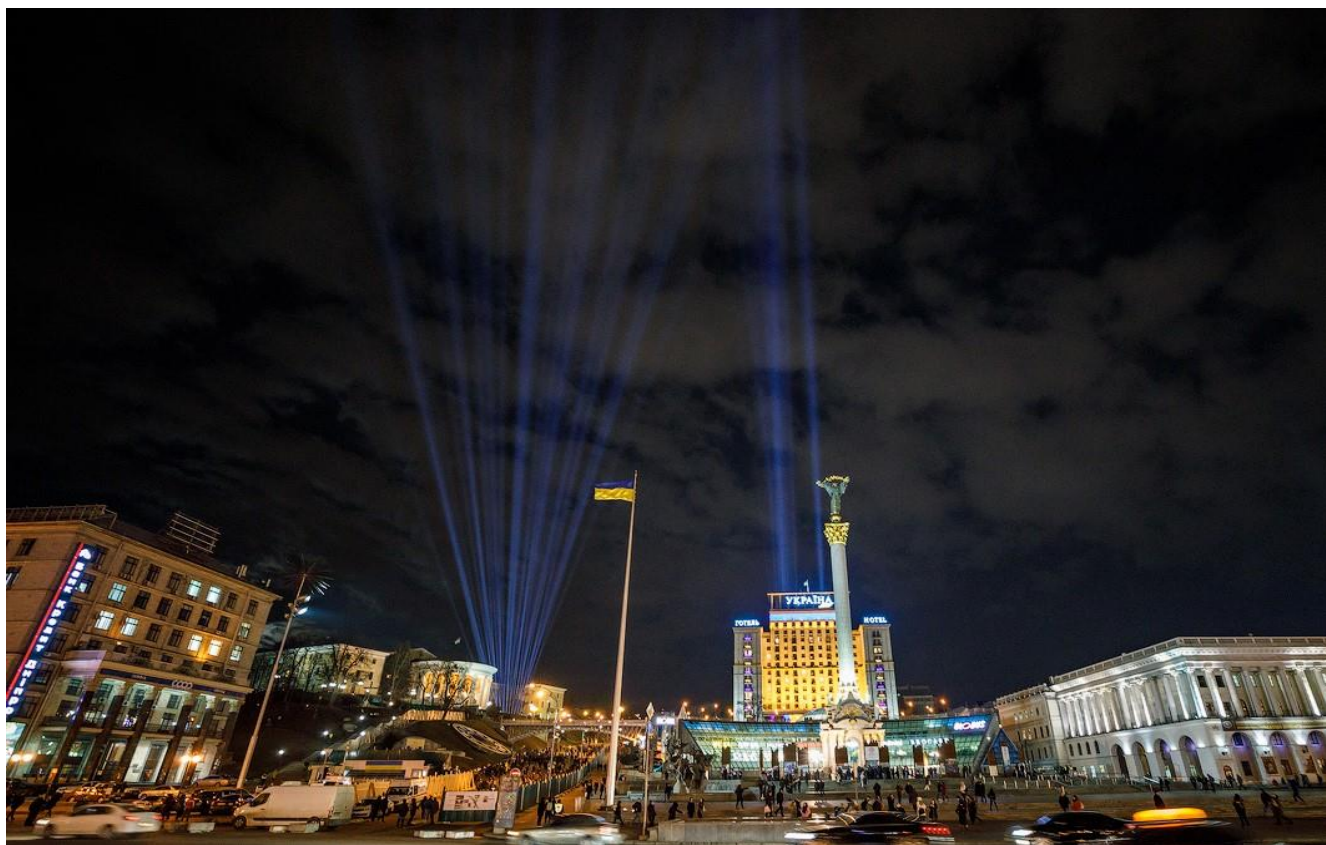
Промені Гідності. Світлина з медіаархіву НМРГ

До другої річниці створення Музею, 18 листопада 2017 року, світлову інсталяцію розмістили на місці майбутнього меморіально-музейного комплексу. До початку широкомасштабного вторгнення росії в Україну щороку 20 лютого під час відзначення Дня Героїв Небесної Сотні на знак пам'яті про загиблих учасників Революції Гідності на алеї Героїв Небесної Сотні Музей запалював 107 променів. Під час режиму воєнного стану з огляду на безпекові заходи промені не запалюють.