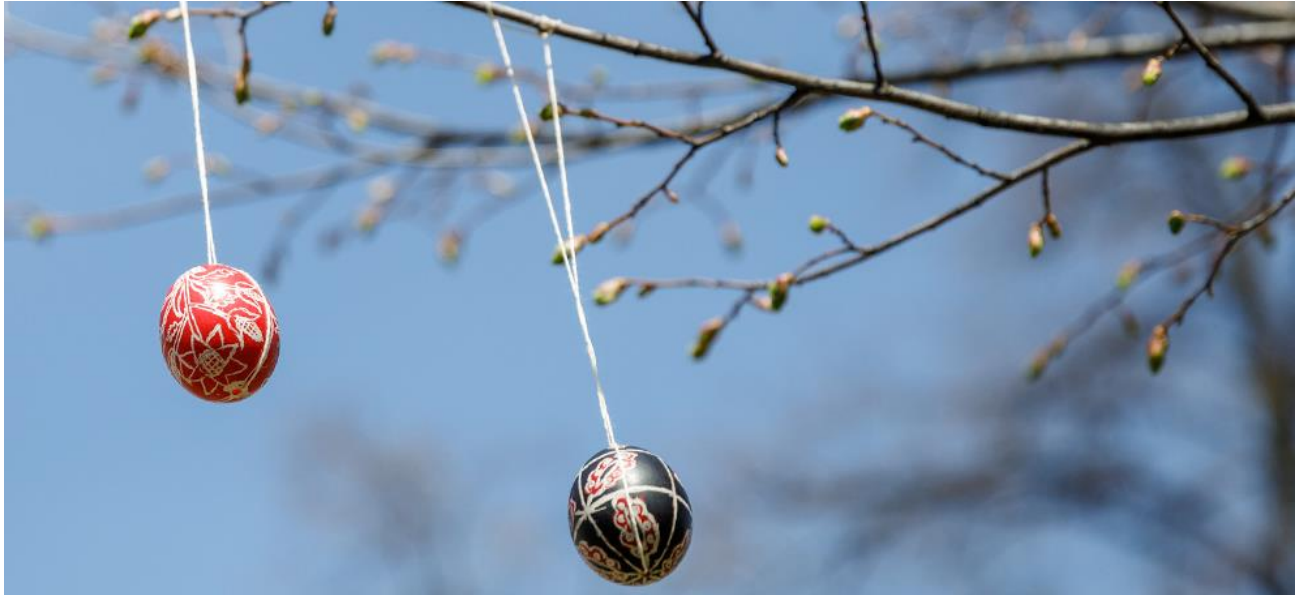
Великодні символи на алеї Героїв Небесної Сотні.

Акцію “Різдво для Героя” було ініційовано родинами Героїв Небесної Сотні. У межах заходу для вшанування загиблих до пам’ятних місць кладуть різдвяні вінки, сплетені напередодні.