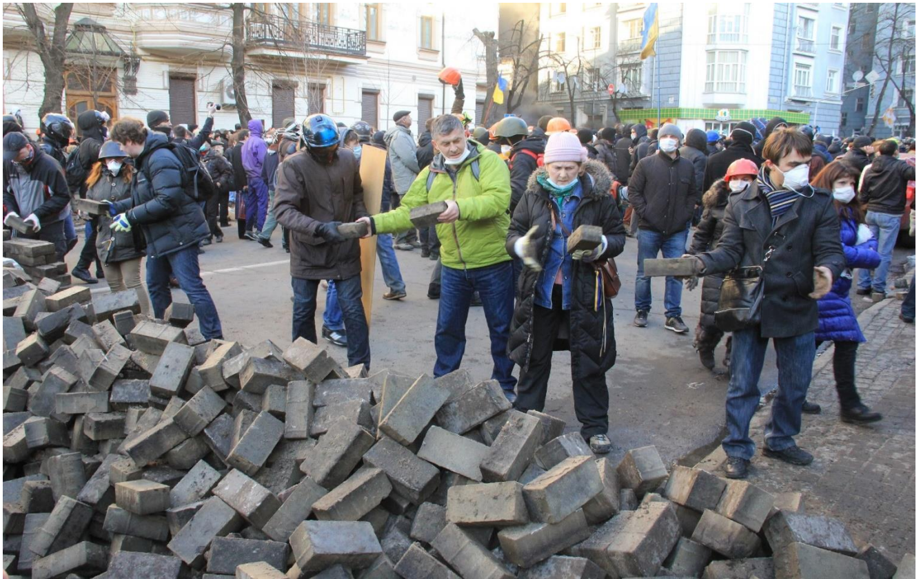
Зведення барикад на вул. Інститутській 18 лютого.

О 16:03 СБУ та МВС висунули опозиції ультиматум – припинити протистояння та звільнити Майдан до 18:00.