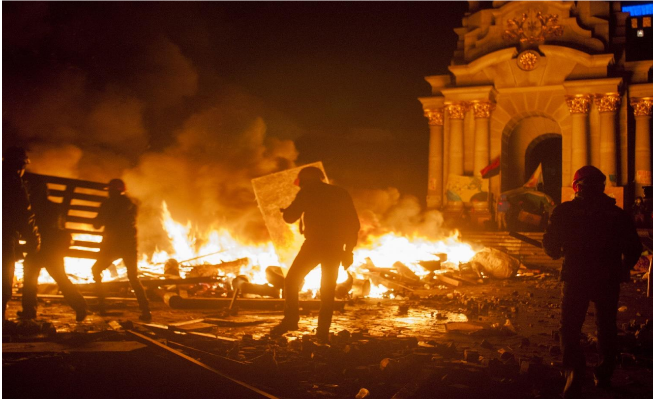
Ніч 19 лютого на майдані Незалежності.

О третій ночі барикаду на Хрещатику з боку Європейської площі було зруйновано, а від Будинку Федерації профспілок України до монумента Незалежності простягалася вогняна барикада.